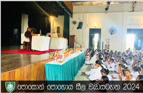
පොසොන් පොහොය සීල වැඩසටහන 2024

"සමනාමයං මහාරාජ ධම්මරාජස්ස සාවකා නමෙව අනුකම්පාය ජම්බුදීපා ඉධානතා."